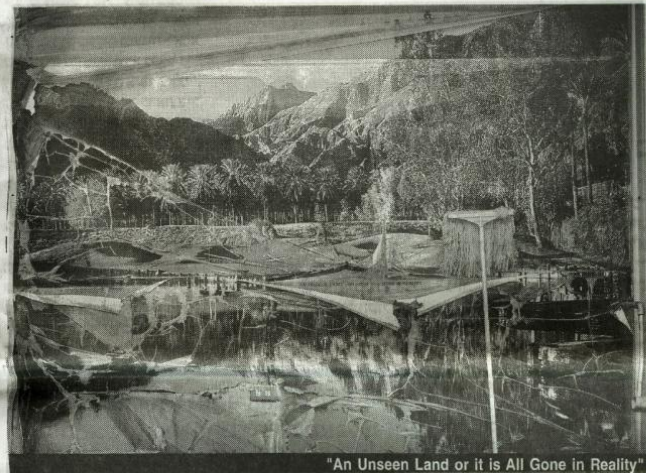
"An Unseen Land or it is All Gone in Reality"

התערוכה היא הרהור על תקוות, חלומות ואשלייות של הדימוי הצילומי, בעיקר בשלב שבו טרם הוטמע לחלוטין כעוד מדיה אמנותית ועדיין נתפש במעגלים רחבים כדובר "אמת"